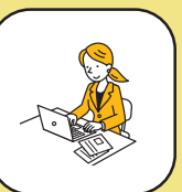
パソコンスキルアップ