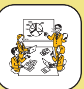
コミュニケーション