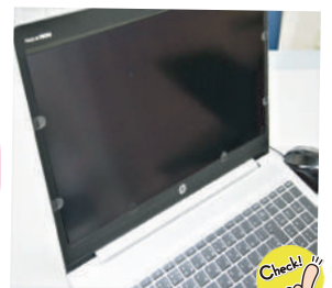
プライバシーフィルター(覗き見防止) 画面にフィルターを取り付けているのでプライバシー面も安心です。