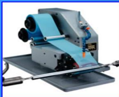
フィルム式超仕上機