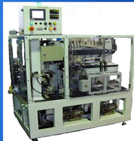
自社製リーク試験機