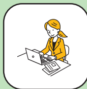
パソコンスキルアップ