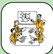
コミュニケーション