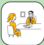
面接シミュレーション