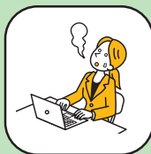
ストレスマネジメント