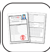
応募書類作成 ・面接対策