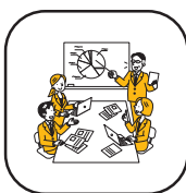
コミュニケーション