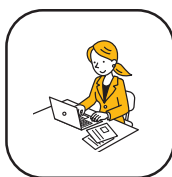
パソコンスキルアップ