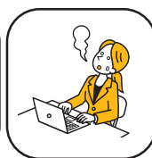
ストレスマネジメント