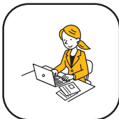
パソコンスキルアップ