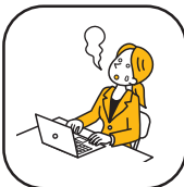
ストレスマネジメント