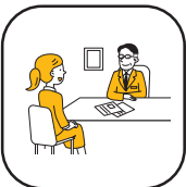
面接シミュレーション