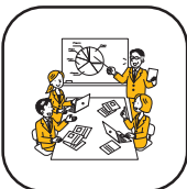
コミュニケーション