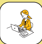
パソコンスキルアップ