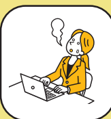
ストレスマネジメント