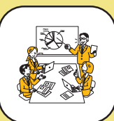
コミュニケーション