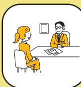
面接シミュレーション