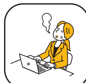
ストレスマネジメント