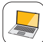
パソコンスキルアップ