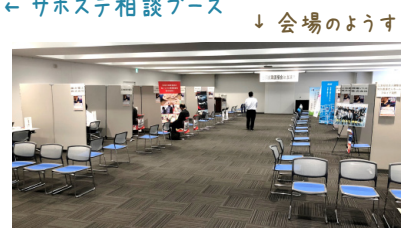
← サポステ相談ブース ↓ 会場のようす